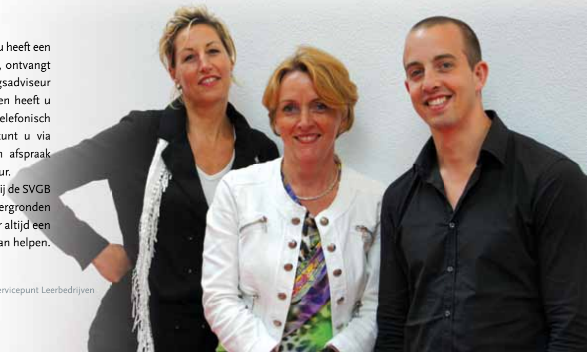
Medewerkers van Servicepunt Leerbedrijven

Wilt u meer weten over het erkennings-traject, de ondersteuning van uw praktijkopleider of controleren of uw gegevens nog juist in het SVGB register erkende leerbedrijven staan? Kijk op www.svgb.nl , artus.svgb.nl/bedrijvenregister of neem contact op met het Servicepunt Leerbedrijven via 030 – 630 40 41 of servicepunt@svgb.nl . ■